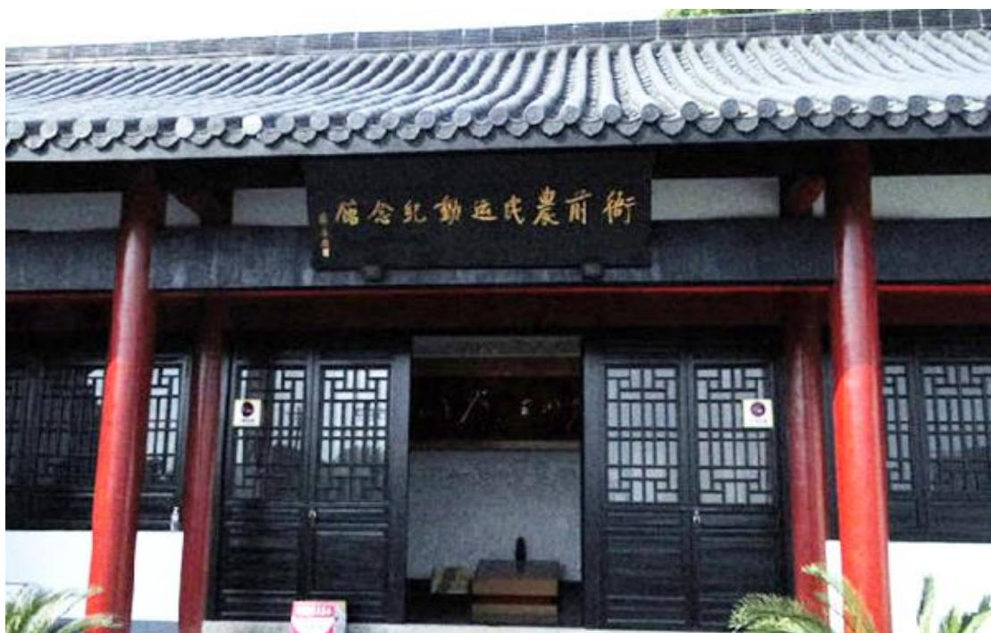
浙江萧山衙前农民运动纪念馆