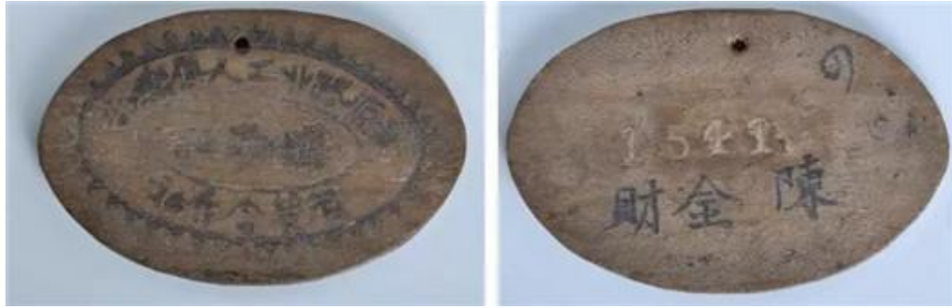
安源路矿工人消费合作社购物证

合作社主要售卖大米、布匹、油盐等生活必需品，这些货物大多从长沙、株洲等地采购，由工人顺便捎回，因而免去了运费，所以货物价格比市场上便宜很多。凡是安源路矿工人俱乐部的部员，可凭合作社发给的购物证到合作社购买低价物品，否则按市场价购买，以防止中间商和工头倒卖，赚取中间差价，扰乱市场。