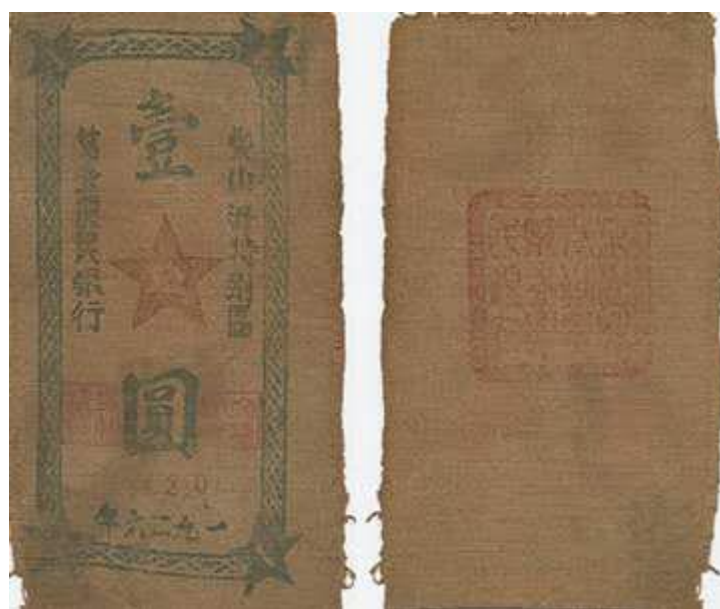
柴山洲特别区第一农民银行壹元布币