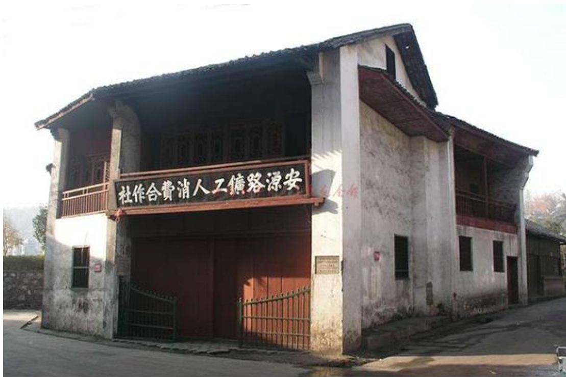
安源路矿工人消费合作社旧址