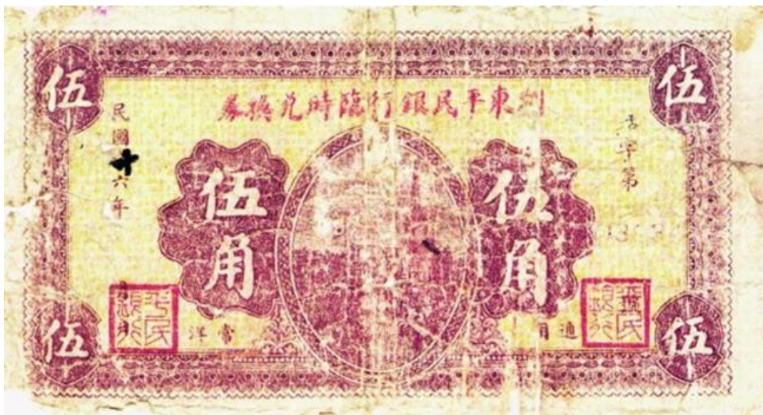
➤ 浏东平民银行临时兑换券

常洋伍角临时兑换券长十五厘米，宽八厘米，正面印有“浏东平民银行临时兑换券”和“伍角”等字样，还印有发行时间，编有号码，左右下方还有“平民银行”小印章，纸币背面印有“摘录浏东平民银行试办章程”，并盖有“浏东平民银行监事会之图记”的方印。常洋二角信用券正面左右两方还印有“打倒资本主义”、“拥护农工政策”字样，体现了平民银行为工农服务的革命本色，正中下方印有“此券合成拾角即兑常洋壹元”。体现了以常洋为发行本位的兑换性。