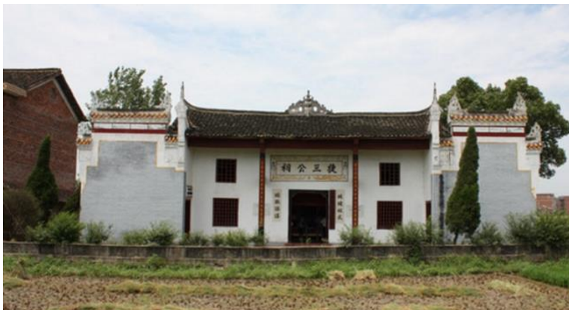
岳北农工会旧址——刘捷三公祠

1923年初，湖南衡山县的岳北、白果一带开始有农会组织的萌芽，1923年春夏之交，受毛泽东和中共湘区委的派遣，刘东轩和谢怀德回到家乡湖南衡山县白果镇岳北村，带回了革命的火种，播响了农民运动的战鼓，于1923年9月，湖南衡山白果成立岳北农工会，随即韶山、银田寺等地陆续成立农民协会。