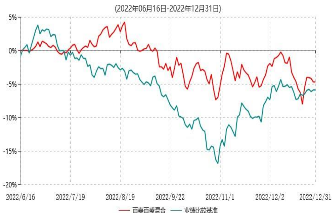
百嘉百盛混合型证券投资基金累计净值增长率与业绩比较基准收益率历史走势对比图

注：1、本基金的基金合同于2022年6月16日生效，截至2022年12月31日，本基金合同生效未满1年。