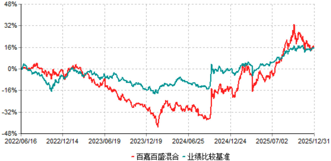
百嘉百盛混合累计净值增长率与业绩比较基准收益率历史走势对比图 (2022年06月16日-2025年12月31日)

注：本基金的投资组合比例为：本基金的股票及存托凭证投资比例为基金资产的60%-95%，投资于港股通标的股票的比例不超过本基金所投资股票资产的50%。本基金每个交易日日终在扣除国债期货合约、股指期货合约和股票期权合约需缴纳的交易保证金后，应当保持不低于基金资产净值5%的现金或到期日在一年以内的政府债券；其中现金不包括结算备付金、存出保证金、应收申购款等。